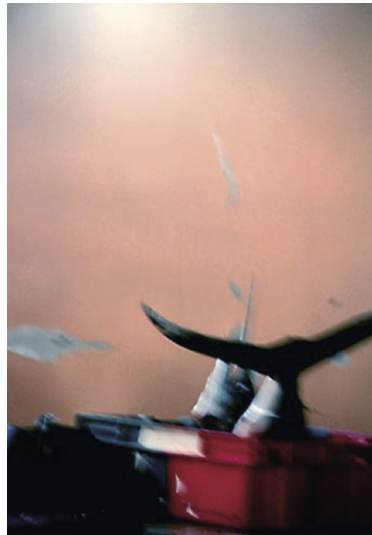
„Schwertfisch“ - 2003

Sie erschaffen durch Kombination, Hinzufügen, Entfernen und Modifizieren von Elementen neue Welten, die zwar real scheinen, jedoch durch diese manipulativen Eingriffe in ihrer atmosphärischen Ausstrahlung gesteigert und „verschoben“ sind.