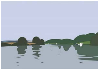
“The original plan was to...”, 2003