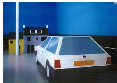
“You are driving along in a ford”, 1996