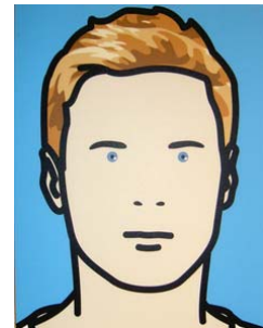
“Bryan Rockstar 3”