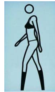
“Sara Walking in Bra, Pants and Boots”, 2003