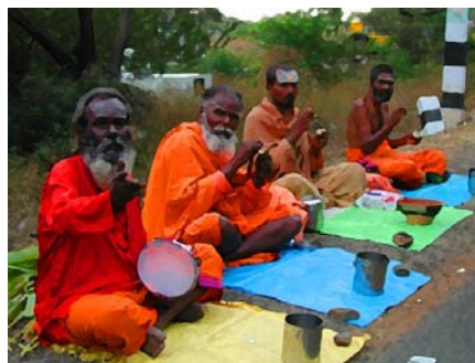
sadhus chanting in Tiruvannamalai