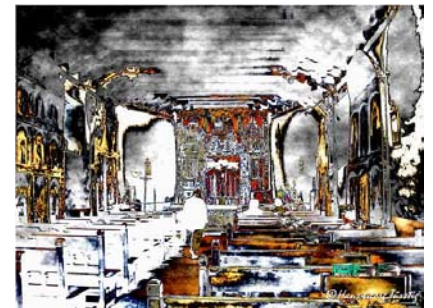
Chimayo – 01